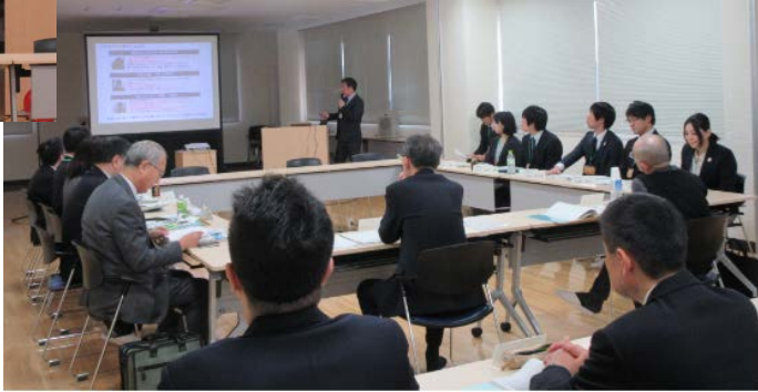
研究員による 桑折町への報告