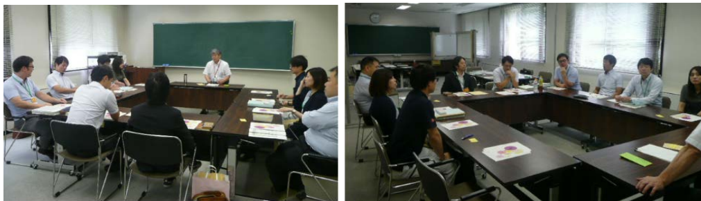
全体打合せの様様

第6回から第9回においては、習得した発想法や手法を活用しながら、桑折町にとって大切な政策提言ができるよう、グループ内活動を精力的に行いました。