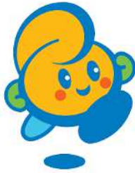
会津坂下町イメージキャラクター バンビィ