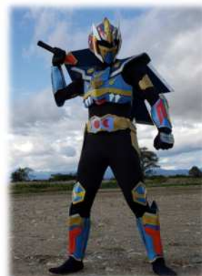
大俵引きイメージキャラクター 初市戦士タワライガー